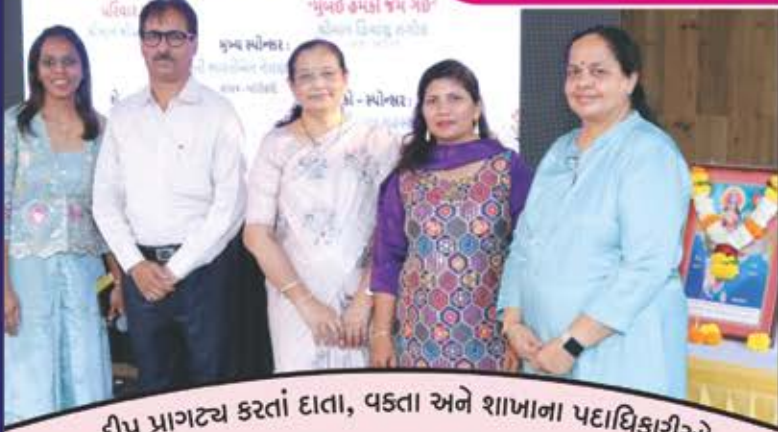
દીપ પ્રાગટ્ય કરતાં દાતા, વક્તા અને શાખાના પદાધિકારીઓ