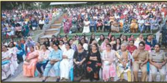
કાર્યક્રમને માણી રહેલ ૯૦૦ + મહિલાઓ