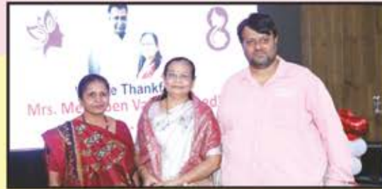
સહયોગી દાતા પરિવારનું સન્માન