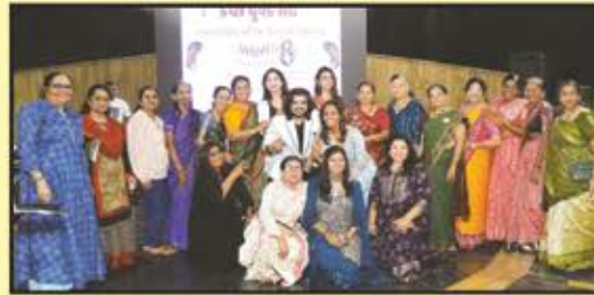
કાર્યક્રમની મહિલા કમિટી