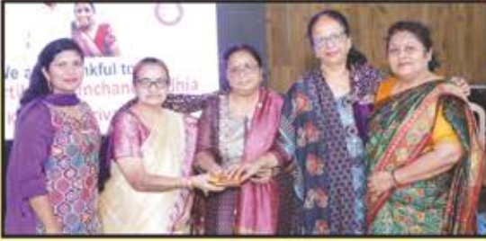
મુખ્ય દાતા પરિવારનું સન્માન

આંતરરાષ્ટ્રીય મહિલા દિવસ ઉજવણીની અવિસ્મરણીય પળો અને આભારની અભિવ્યક્તિ